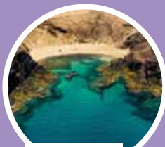
Playa Papagayo, Lanzarote